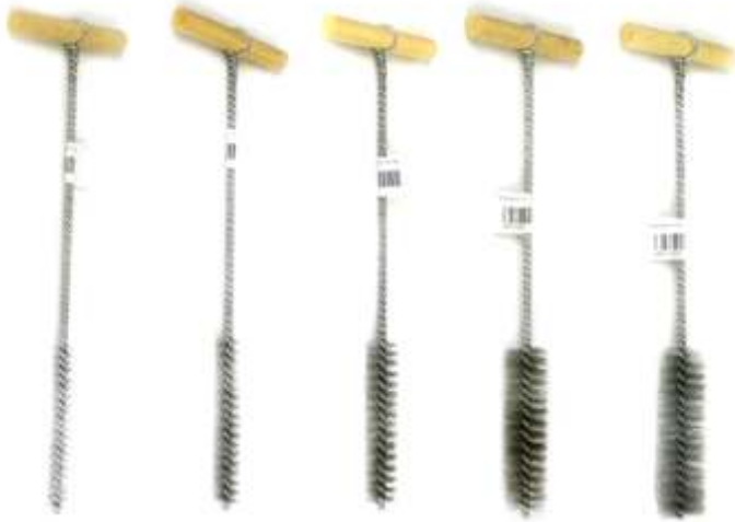
Ручные ершики для прочистки отверстий BOSSONG D10 - D28